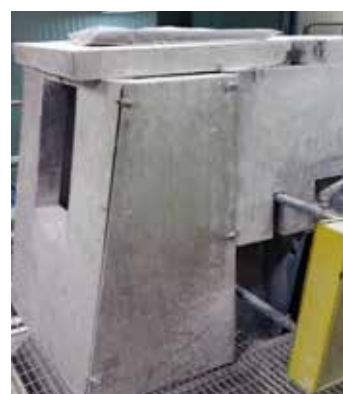
Inom industrin finns maskiner som alstrar buller. Det är viktigt att försöka förebygga men också att skydda öronen.