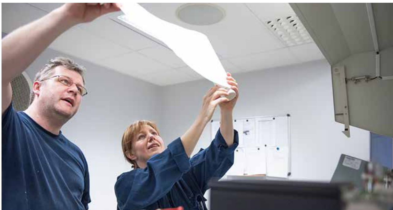
Förtroendefull samverkan är temat för Sirius Forum i januari nästa år.