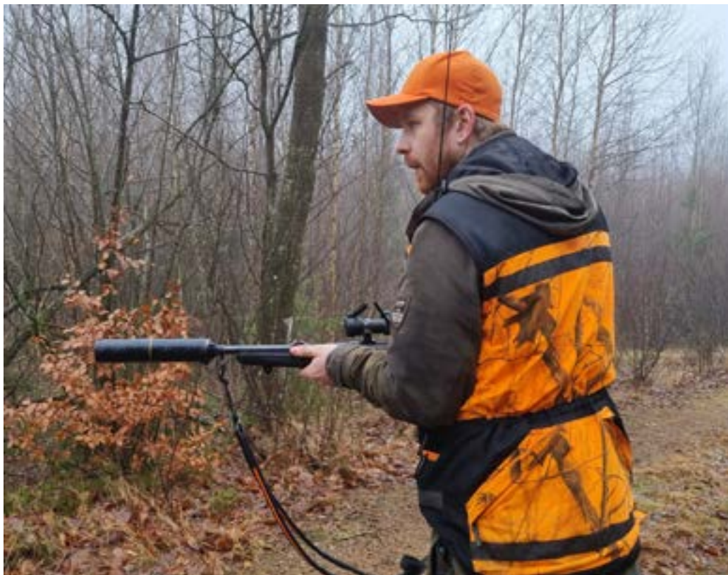
När hundarna skäller gäller det att försöka förutse var vildsvinet kommer springa och vara beredd.

Det är mitten på december och klockan närmar sig 09 på morgonen när jag ser en skylt längs vägkanten som säger "Jakt pågår". Jag kör vidare och när min GPS visar 2min till ankomst passerar jag ännu en skylt. Skylten innebär att man ska köra försiktigt och vara extra uppmärksam, då hundar kan vara lösa och springa över vägen. Det känns spännande, jag har aldrig varit med på en jakt förut så jag vet inte riktigt vad jag ska vänta mig.